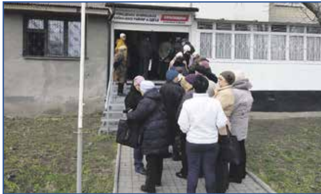
Черга за лампочками в офіс ВО «Батьківщина»

Популізм (від лат. populus — народ) — політика, яка апелює до простих народних мас, їх надій, страхів, незадоволення життям, і ґрунтується на протиставленні інтересів широких мас населення інтересам еліти. Поняття найчастіше вживається для означення