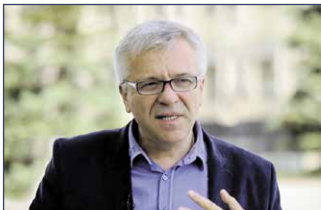
На фото: Александр ОСТАПЕНКО, председатель полицейской комиссии Одесской области, председатель одесского регионального офиса МДО «Депутатский контроль»