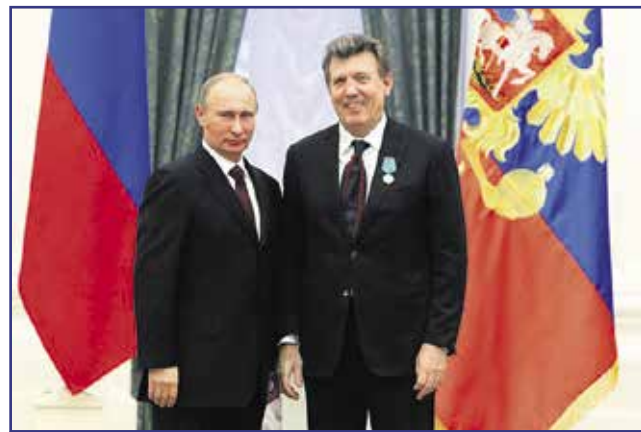
На фото: президент Российской Федерации Владимир Путин вручил медаль Пушкина Сергею Кивалову

благодарности и т.д.) — 60. Орден «За благородство помыслов и дел I ст. — 1.