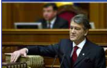
...присягаю на вірність Україні