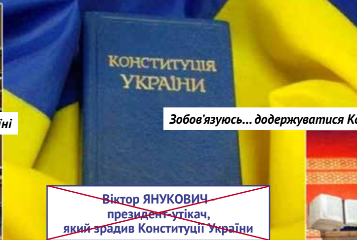
Зобов'язуюсь... додержуватися Конституції України